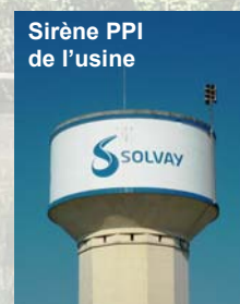
Sirène PPI de l'usine

Au sein de l'établissement, le Système de Gestion de la Sécurité (SGS) définit, dans les domaines de la sécurité, l'hygiène et l'environnement, les rôles et les responsabilités à tous les niveaux, les procédures à suivre et les modalités de contrôles.