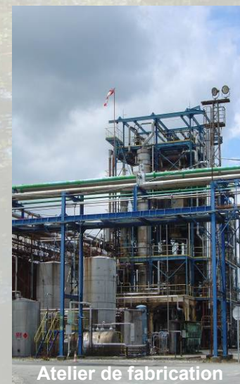
Atelier de fabrication

Même si la probabilité qu'un sinistre grave se produise est minime, le voisinage immédiat du site peut être concerné. Une parfaite maîtrise des risques technologiques et l'information des populations sont des objectifs prioritaires.