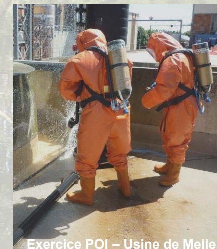
Exercice POI – Usine de Melle

Suite à l'accident industriel majeur survenu à Seveso en Italie en 1976, les instances européennes ont adopté une directive baptisée "Seveso" (renforcée en 1996). Cette directive impose aux États membres de l'Union Européenne la mise en place d'une législation spécifique à l'égard de ces établissements dont l'activité peut présenter un risque industriel. Si ce risque est considéré comme majeur, ces entreprises sont classées "Seveso seuil haut" et doivent informer les populations riveraines. C'est l'objet de cette plaquette d'information.