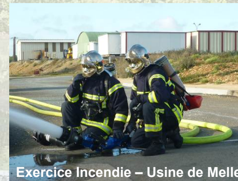
Exercice Incendie – Usine de Melle