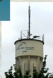
Sirène PPI en centre-ville de Melle